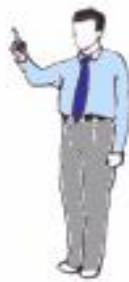
2. Désignation du combattant ( Tchong/Hong )