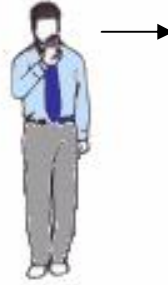
3. Geste de gauche à droite de la main