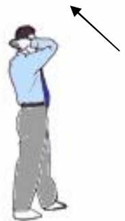
Geste de reprise du combat : Kyesok