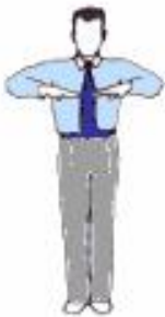
4. Exécution des saluts : Kyeong-rye