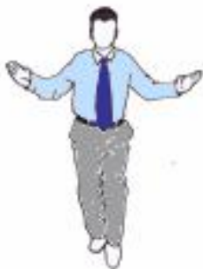
7. Arment du geste de début de combat