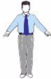
2. Appel des combattants : Tchong - Hong ( indication des emplacements )